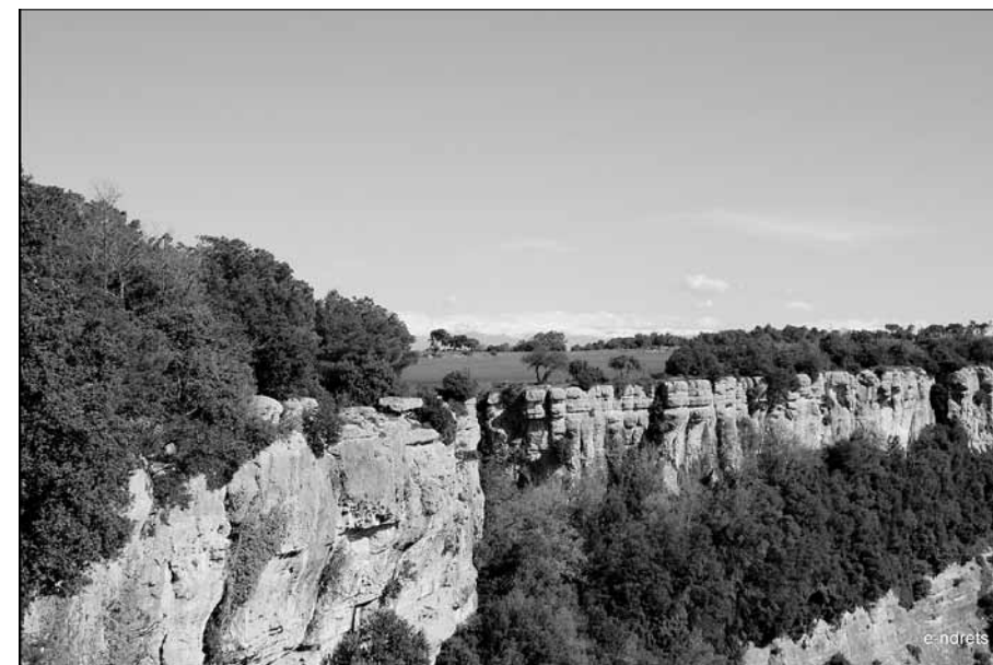
Els cingles de Bertí.

Joan Triadú fou un dels iniciadors del concurs parroquial de poesia de Cantonigròs, el 1944, en plena nit franquista i de gran transcendència per a la cultura del país. Triadú hi féu estada per curar-se d'una tuberculosi latent i, a banda de l'activisme polític i cultural, hi escriví El Collsacabra. Itinerari espiritual (1957), que fixà literàriament aquesta part del territori. Pobles com Rupit i Tavertet són part essencial d'aquesta marca.