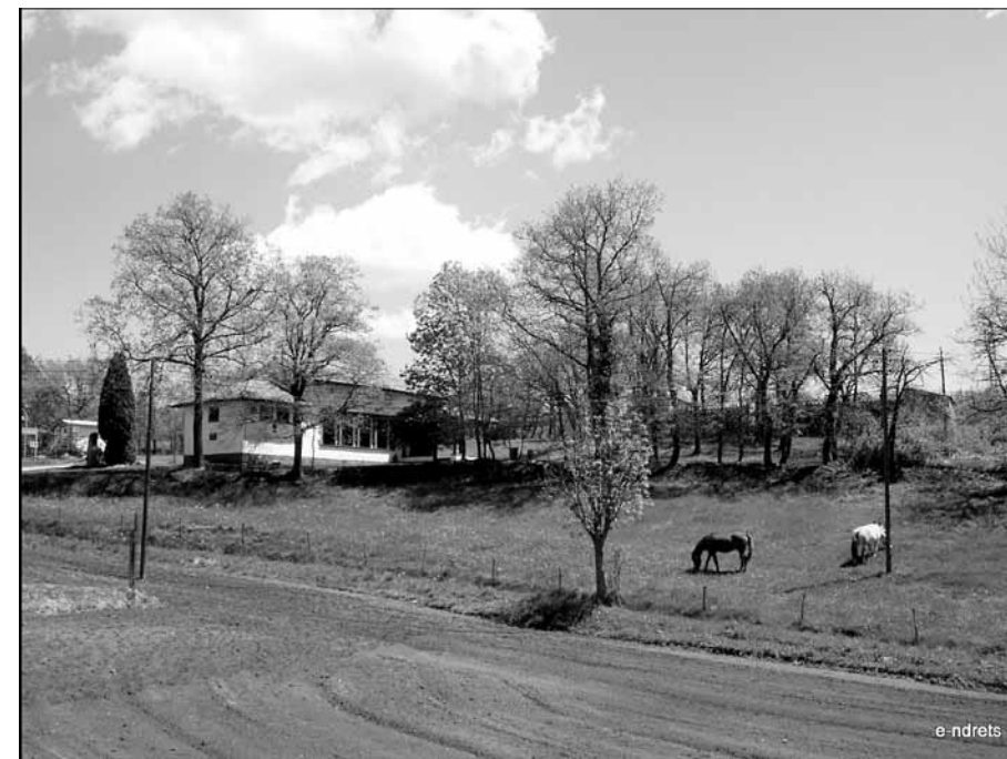
Escola parroquial de Cantonigròs a Santa Maria de Corcó.