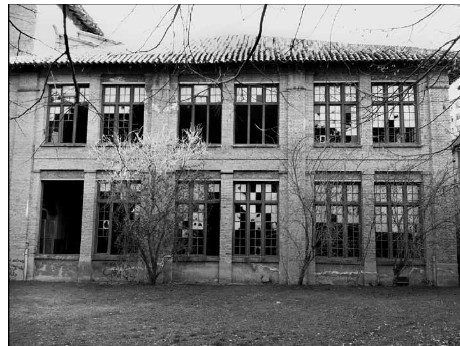
Nau de la fàbrica La Blava a Roda de Ter.