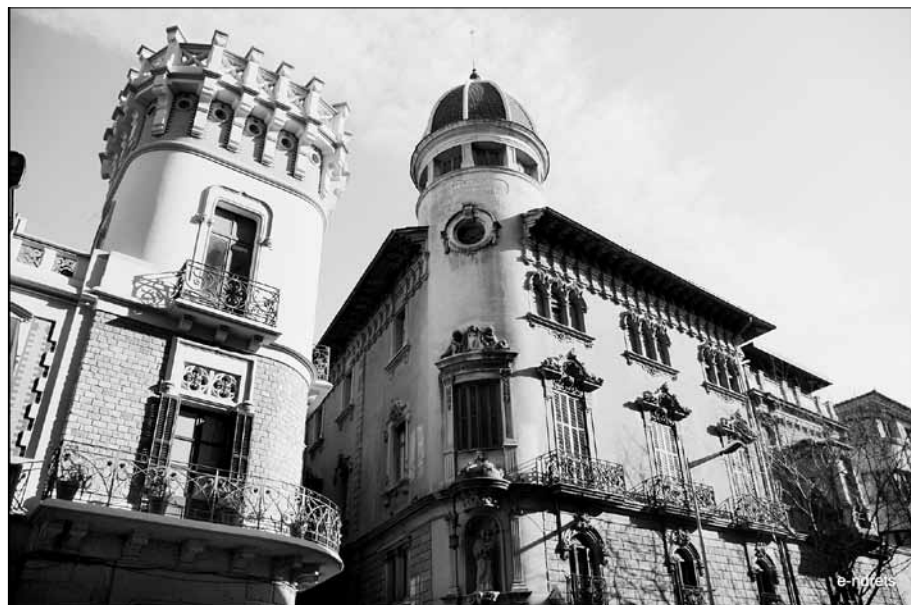
Casal dels Rocafiguera de la rambla de l'Hospital estant.