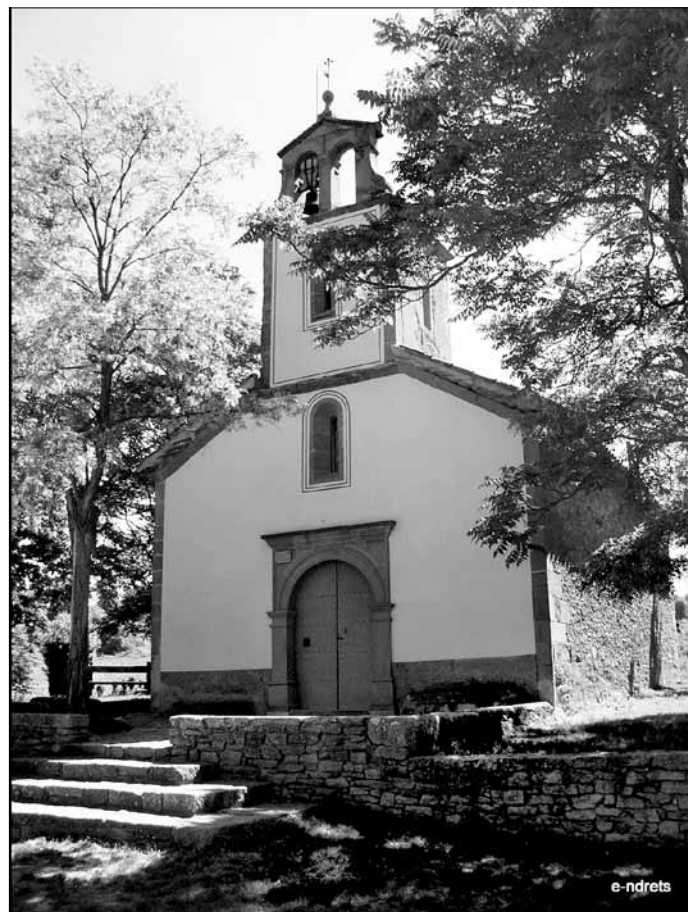
Ermita de la Damunt a Folgueroles.