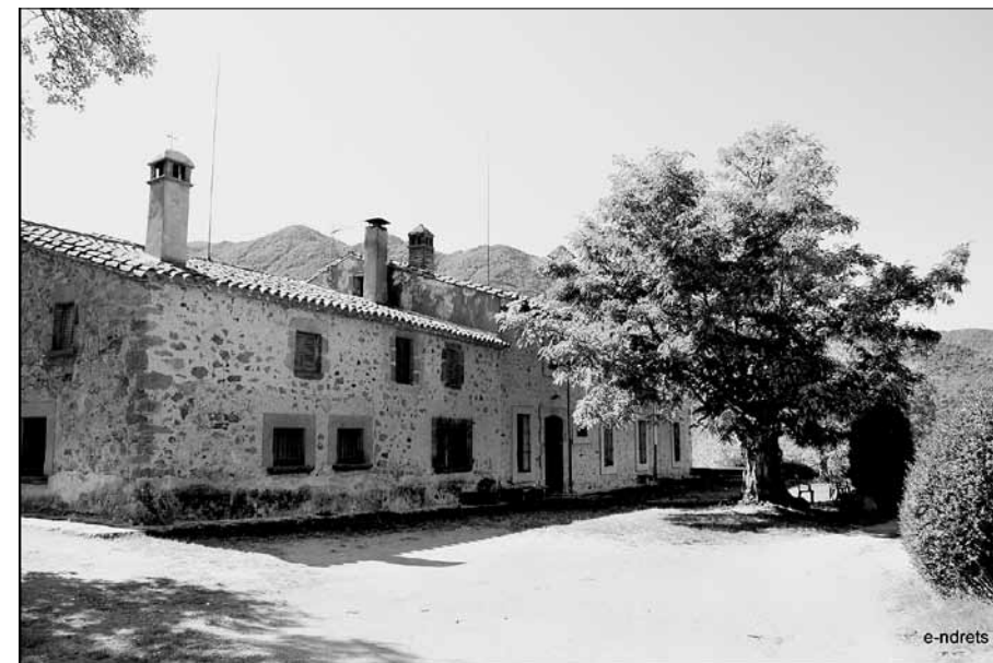
Casal de can Rusquelles a Viladrau.

Al llarg d'aquests sojorns viladrauencs elaborà Laia i una bona part dels contes d' Aspectes .