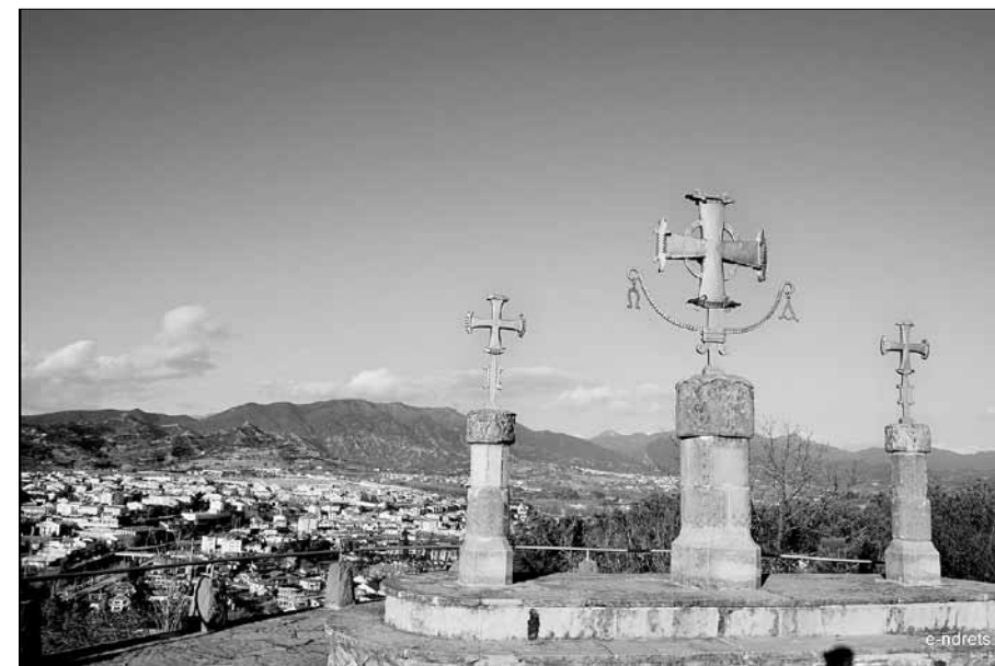
Torelló i la serra de Bellmunt del turó de les Tres Creus estant.