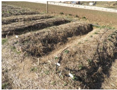
Imatge de bancals elevats 2