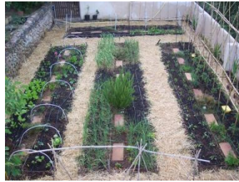
Imatges de parades en crestell 5