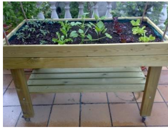
Imatge d'una taula de cultiu 4