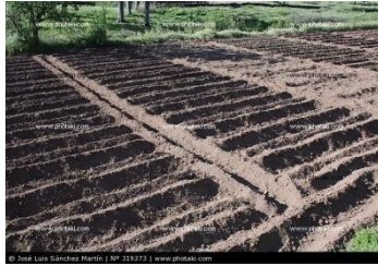
Imatge d'hort en solcs 1

L'hort en solcs cal preparar-lo cada vegada que si vol sembrar un nou cultiu. Aquesta tasca es pot fer amb l'ajuda dels infants.