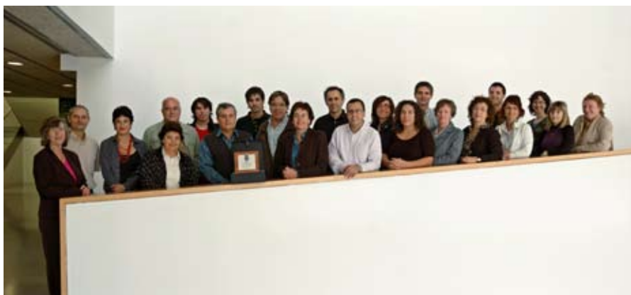
Una part del professorat de la Facultat de Ciències Humanes, Traducció i Documentació amb el premi.

El premi està dotat amb 20.000 euros. Les candidatures a la Distinció Vicens Vives les presenten els Consells Socials de les universitats públiques, o òrgans equivalents de les privades, a través de la Secretaria del Consell Interuniversitari de Catalunya (CIC).