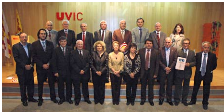
Els representants de les empreses i institucions mecenes en l'acte de lliurament de la Medalla.

Les empreses i institucions mecenes de la Universitat de Vic varen rebre el 17 d'octubre la medalla de la UVic, màxima distinció de la institució, en l'acte acadèmic d'inauguració del curs 2008-2009 "pel seu suport imprescindible al projecte universitari de la ciutat des de l'aprovació de la Universitat de Vic per unanimitat del Parlament de Catalunya el 21 de maig de 1997; per la seva desinteressada aportació econòmica en uns moments fonamentals per al creixement de la Universitat de Vic, i específicament per a la construcció de la segona torre de l'edifici F, el més emblemàtic del campus de Miramarges; per la seva voluntat manifesta de continuar col·laborant en el desenvolupament i el creixement de la Universitat a través de projectes de recerca, de transferència de coneixement, d'innovació tecnològica, d'emprenedoria, de pràctiques i de formació en general."