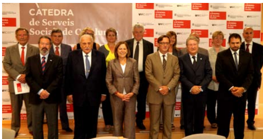
Constitució del Comitè d'Honor de la Càtedra de Serveis Socials

Va néixer a Barcelona el 1918 de pare indi i mare catalana. De jove va ordenar-se sacerdot i als anys seixanta va anar a l'Índia on va viure durant quaranta anys. També va fer freqüents estades als Estats Units, i fa vint-i-dos anys va instal·lar-se a Tavertet on va crear la Fundació Vivàrium per difondre el seu pensament. Autor de més de vuitanta llibres, va rebre la Creu de Sant Jordi el 1999. L'estiu del 2003 va ser nomenat professor honorífic de la Universitat de Vic.