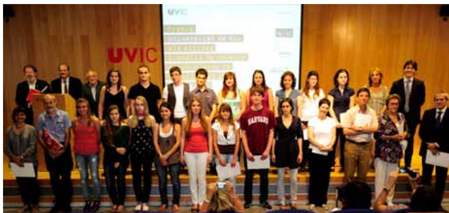
Els premiats i premiades amb el rector de la UVic, el director general de Recerca de la Generalitat de Catalunya i els representants de les empreses patrocinadores dels premis.

El 21 de juny va tenir lloc a l'Aula Magna el lliurament dels Premis Universitat de Vic als millors treballs de recerca de batxillerat, que enguany van arribar a la 13a edició.