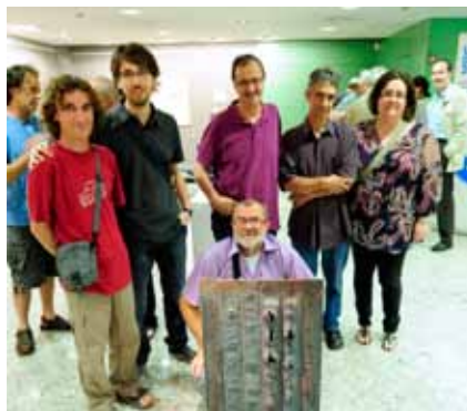
Alguns dels artistes amb la seva obra.

Del 17 de juny al 17 de juliol es va poder veure a la Sala d'art Unnim de Vic, en el marc de la Plataforma Cultural