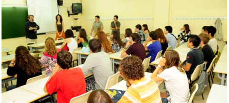
Un dels grups de la Junior University a classe.

Més de 1.000 persones van participar en els cursos, jornades i escoles d'estiu de l'edició d'enguany de la Universitat d'Estiu de Vic. Destaca l'èxit de participació de les nou jornades de diversos àmbits de coneixement i les escoles d'estiu que es van dur a terme.