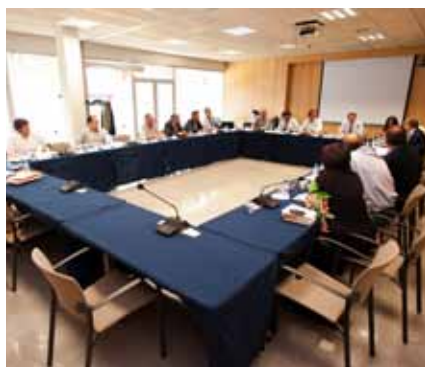
Reunió del Patronat de la FUB-UVic el 19 de juliol a la Universitat de Vic.