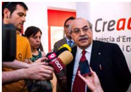
Andreu Mas-Colell a la seu de Creacció.

La Farga ha desenvolupat, conjuntament amb la Universitat de Vic, un nou mòdul a les instal·lacions del Museu del Coure per tal de demostrar a través d'un estudi científic propi les propietats de les superfícies