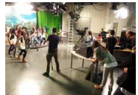
Un moment de la filmació del bodydub al plató de televisió de la UVic

treballat des d'algunes assignatures dels graus de Teràpia Ocupacional, Mestre d'Educació Infantil i Primària, Educació Social i CAFE, precisament per la relació directa que tenen alguns dels objectius d'aquesta formació amb els beneficis que ofereix la percussió corporal.