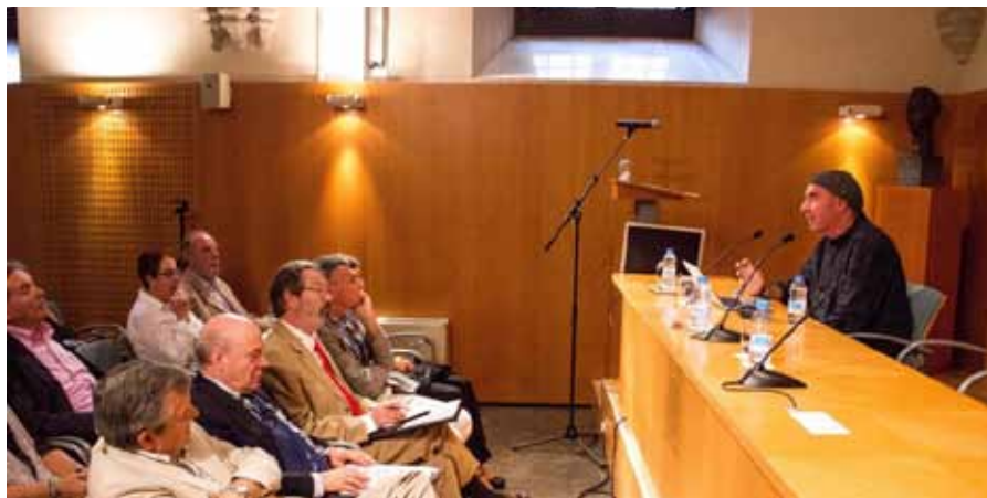
Intervenció de Lluís Llach a l'Institut d'Estudis Catalans en l'acte d'inauguració del Col·loqui.