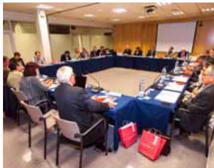
Reunió del Patronat de la FUB-UVic el 28 d'octubre a la Universitat de Vic.