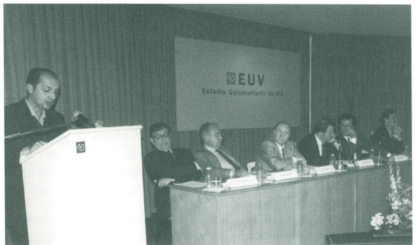
Taula presidencial el dia de la Inauguració del curs 1996-97.

Del 19 de novembre al 19 de desembre l'Escola Universitària Politècnica d'Osona organitza el Curs d'Introducció a l'Explotació Forestal , adreçat a propietaris forestals, tècnics i estudiants d'Enginyeria Tècnica Agrícola o d'Empresarials, així com a totes aquelles persones que estiguin interessades a tenir uns coneixements bàsics d'explotació i gestió de boscos. El curs es divideix en 11 sessions i comptarà amb des-