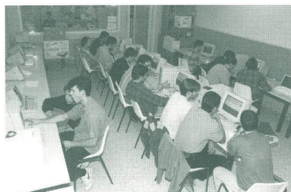
Aspecte de la sala de VAX, on els alumnes ja poden connectar amb Internet.

Des de finals d'octubre, tots els alumnes dels EUV poden connectar lliurement amb Internet, gràcies a 8 ordinadors que s'han instal·lat a l'Aula de VAX. La connexió amb Internet es farà servir només amb finalitats educatives i de recerca. L'accés per a tothom que ho desitgi serà gratuït. Està previst que, en un termini no gaire llarg, es pugui ampliar la capacitat d'aquests 8 ordinadors a tota una aula completa. Un cop hi hagi aquesta aula, es realitzaran classes assistides per a alumnes de diferents titulacions amb la finalitat que aprenguin a moure's per Internet i per les adreces que els siguin més útils en el seu futur professional. Fins aquests moments, els alumnes només podien accedir a Internet a través de la biblioteca, gràcies a 2 ordinadors.