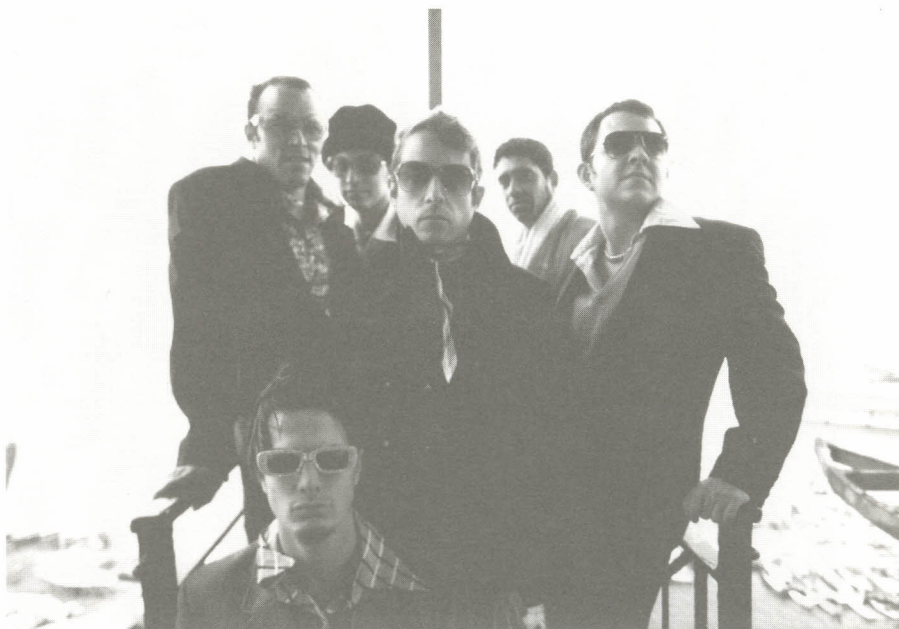
El grup Azucarillo Kings actuarà el 13 d'abril a la plaça Major de Vic.

El matí del dia 10 de juny hi haurà una Jornada de Portes Obertes amb visites guiades pel conjunt de les ins-