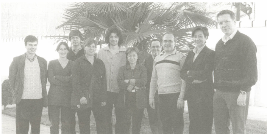
Professors de la UV membres de la comissió organitzadora de les activitats de l'Any Mundial de les Matemàtiques.

També s'ha iniciat el concurs de problemes Mates 2000 a través del bisetmanari El 9 Nou, i es durà a terme una taula rodona sobre «l'Ensenyament de la Matemàtica: del batxillerat a la universitat».