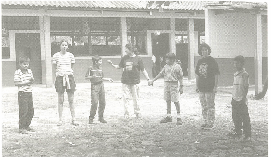
Estudiantes de la Facultat d'Educació amb nens de l'escola de San Pablo Jocopilas.