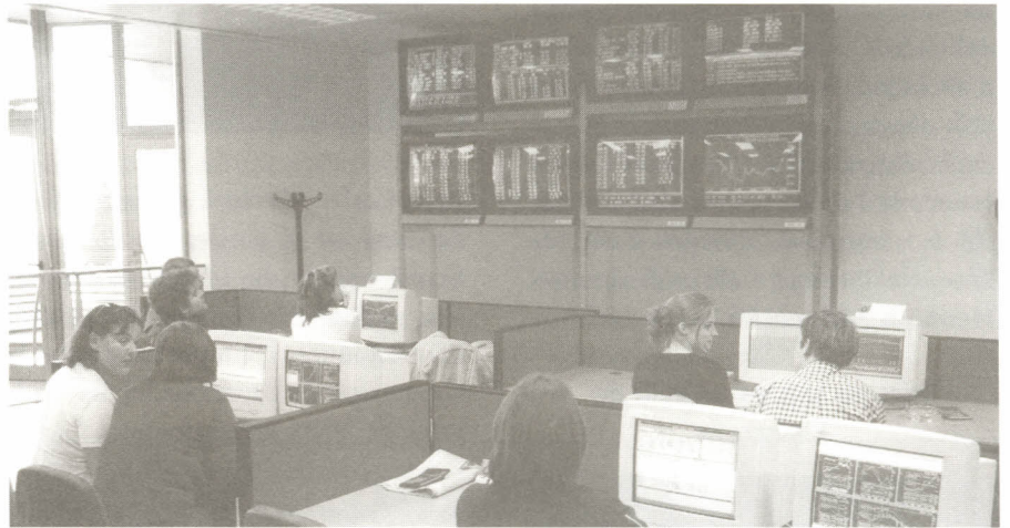
Vista del mimiparquet de borsa de Caixa de Manlleu.

El segon concurs de borsa organitzat per Caixa de Manlleu i la Universitat de Vic tindrà enguany dues fases; la primera, que comença el 6 de novembre, és oberta a tots els equips inscrits i consisteix en la realització d'operacions simulades en temps real, contractades a través del Servei Telefònic de Caixa de Manlleu. Els equips comptaran amb un capital inicial de 60.000 euros i hauran de fer un mínim de 5 operacions per un import mínim de 30.000 euros.