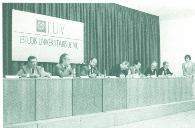
Moment de la signatura del DEGI

L'any 1987-88 vuit estudiants de França, Anglaterra i la RFA varen prendre part en el programa Europeu d'Estudis; el curs 1988-89 eren trenta-set i el curs actual 1989-90 ja són quaranta-dos els joves d'aquests tres països que hi participen. Durant la setmana Europea de Portsmouth del 13 al 18 de novembre de 1988, els rectors varen lliurar els primers Diplomes Europeus als participants; un any més tard va ser a Valenciennes on va tenir lloc el segon lliurament de Diplomes, i durant la setmana Europea que tindrà lloc a Bielefeld el novembre vinent serà la tercera promoció que rebrà el Diploma (...).