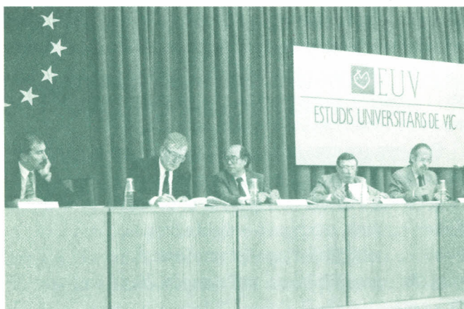
Moment de la signatura del DEGI

A part d'aquest conveni multilateral, es signa amb cada institució un conveni bilateral d'intercanvi d'estudiants i de professors, i de cooperació en activitats d'investigació i de recerca empresarial.