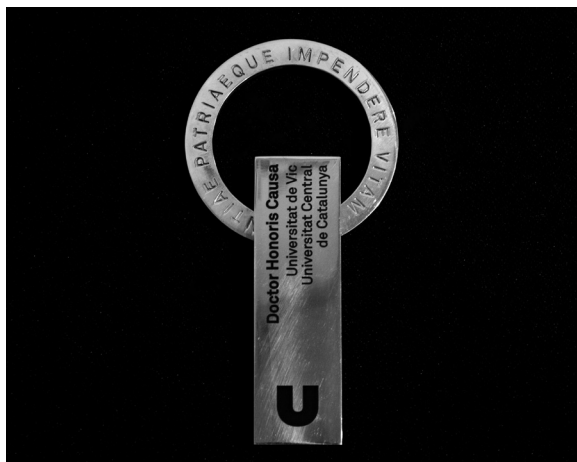
La medalla de doctor honoris causa

Es tracta d'una A sense travesser amb un sol al capdamunt, que simbolitza els coneixements que creixen i conflueixen cap al vèrtex del saber i que, des d'allà, com un sol ixent, il·luminen les intel·ligències humanes.