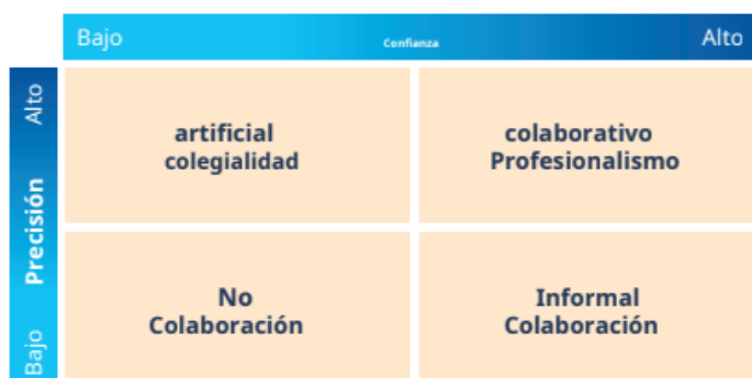
Il·lustració 3: Quadrants de la col·laboració

Hargreaves i O'Connor (2018) parlen de la diferència entre la col·laboració professional i el professionalisme col·laboratiu, com es pot veure a la il·lustració 3, tenint el compte el nivell de confiança i la precisió. El professionalisme col·laboratiu es basa en com les persones col·laboren més a nivell professional i també sobre com desenvolupen la seva professió d'una manera col·lectiva. A la vegada, és normatiu, i consisteix en crear una pràctica professional conjunta més forta i millor, i la col·laboració professional és més descriptiva, dissenya unes línies sobre com les persones treballen juntes en una professió (Hargreaves i O'Connor, 2020).