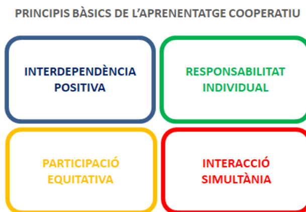
Il·lustració 2: Principis bàsics de l'Aprenentatge Cooperatiu