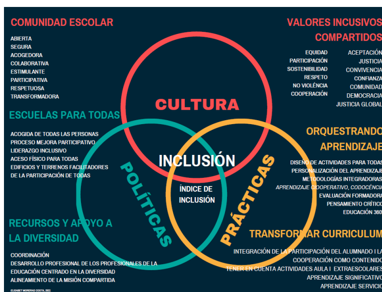
Il·lustració 1: Dimensions de l'Index for inclusion