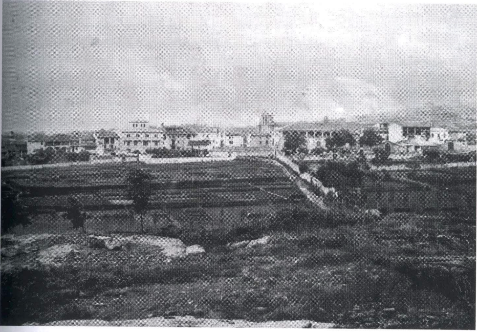
Vista general de Folgueroles amb un sector dels horts, la masia de la Sala i l'església al seu darrere al començament del segle xx.