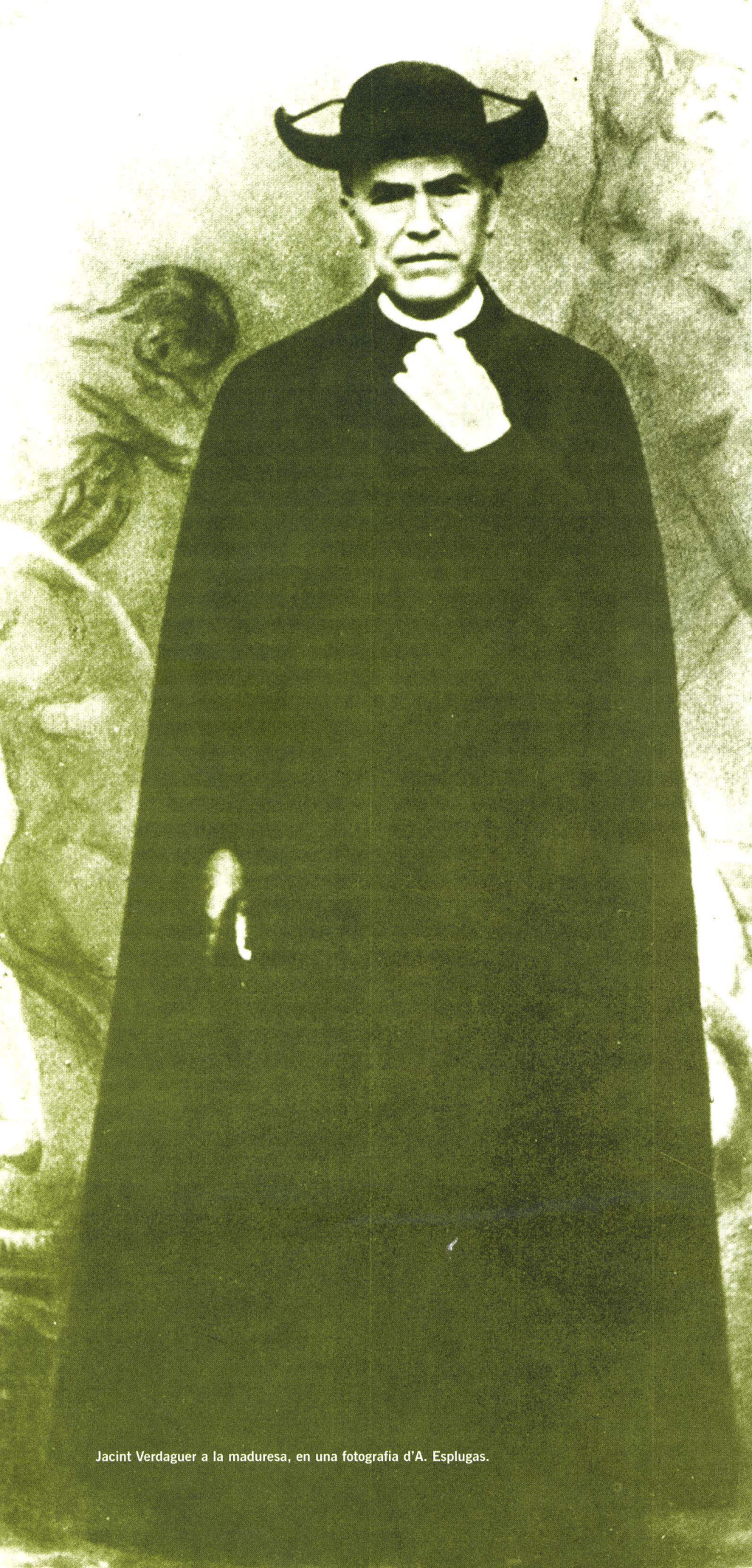
Jacint Verdaguer a la maduresa, en una fotografia d'A. Esplugas.

favor del pastor de Núria, els mitòlegs, els filòsofs i els astrònoms, els sabers d'Aristòtil, Demòcrit i Teofrastes, i tots els savis de Grècia. 4 L'oposició entre el món grecollatí i el judeocristià és antiga i clàssica, però diversa. Verdager se la mira en resposta al llibre Hellas de Paul Mariéton amb molt de coneixement i, sembla, també amb un equilibrari de gran cura. Però, en el fons, ni tan sols no és admesa la Venus Urània. Se situa doncs en una frontera de marca, en un extrem, al marge de la tendència oberta dels apologetes primitius i fins de la posició moderada de Climent d'Alexandria o Basili de Cesarea. Però tampoc no és dels qui veu la solució abans que el problema. En tot cas té el coratge de plantejar-lo, cosa que no fan Chateaubriand ni Costa i Llobera, que jo sàpiga. 5 Míticament, aquesta creu immensa marca en símbol la totalitat còsmica, i, si té per cap visible la Jerusalem terrenal, té per fi la Jerusalem celeste, que és on místicament vol arribar.