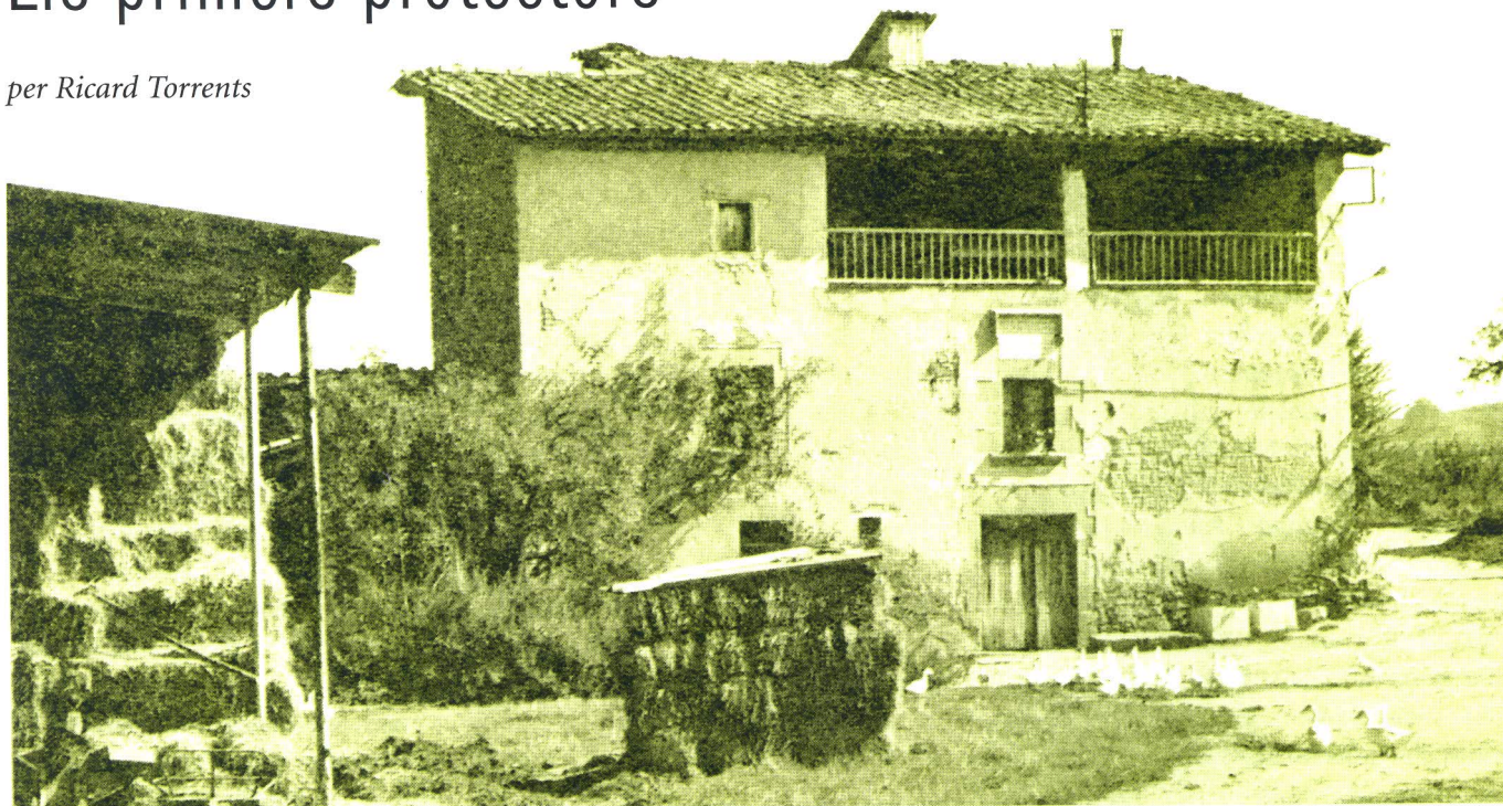
Can Tona. Verdaguer hi visqué en règim d'«estudiant» des de 1863 fins a 1871, quan fou destinat de vicari a Vinyoles d'Orís.