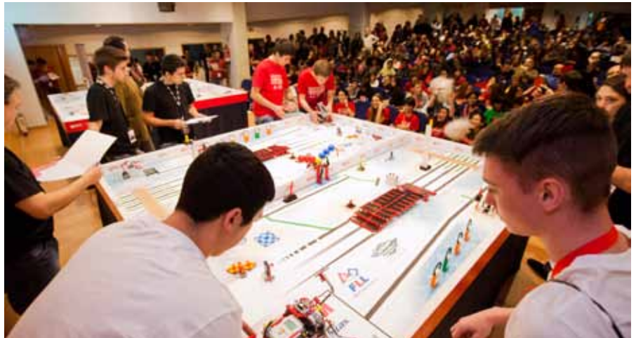
Una imatge de l'escenari de l'Aula Magna amb les taules dels participants a la competició.

El 10 de març va tenir lloc a l'edifici Torre dels Frares el primer torneig de la FIRST Lego League que es du a terme a l'Escola Politècnica Superior de la Universitat de Vic.