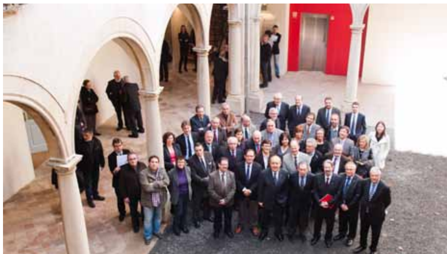
Foto de conjunt de les personalitats assistents a l'acte d'inauguració de Creacció al claustre central de la remodelada Casa de Convalescència.