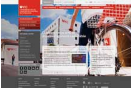
Lloc web de la UVic-UCC

Eumo-dc, empresa de disseny i comunicació vinculada a la Universitat de Vic - Universitat Central de Catalunya, va rebre tres premis Laus de bronze en els apartats de disseny editorial, naming i web en la festa que va tenir lloc al Disseny Hub Barcelona el dijous 26 de juny, als quals es van presentar 1.300 projectes.