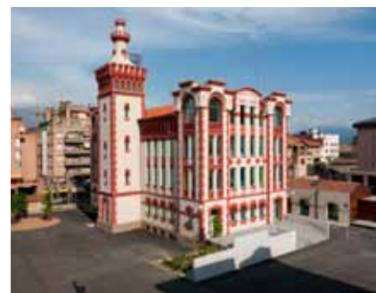
Imatge de La Farinera, a Vic, edifici on s'impartiran els estudis.