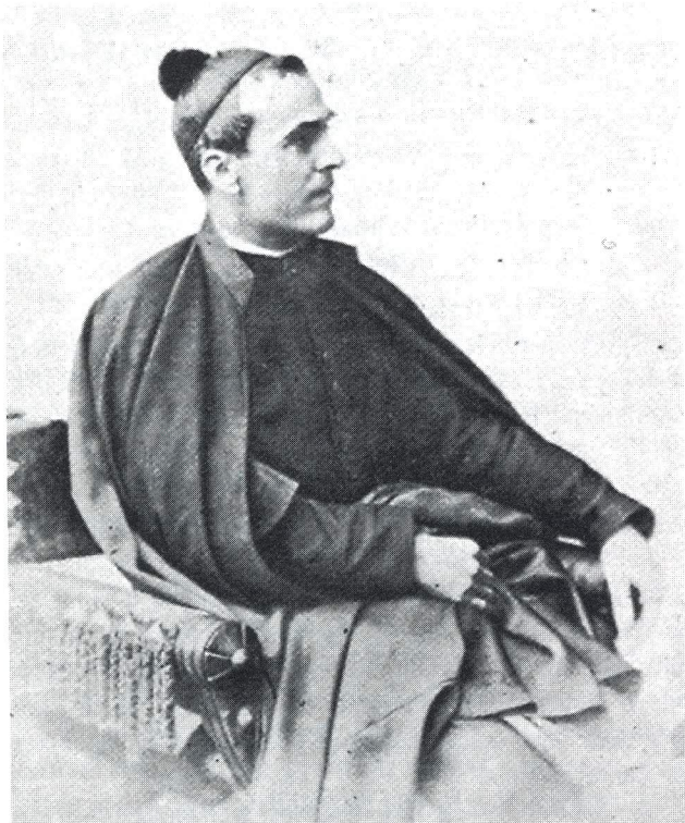
Retrat de Jacint Verdaguer, l'any 1889

Els llibres Flors del Calvari i Al Cel formen part de la darrera etapa de la poesia de Jacint Verdaguer. Aquestes obres, a través dels pròlegs respectius, descriuen una unitat ben pensada per l'autor i els seus poemes mostren alguns dels punts importants d'aquesta poesia.