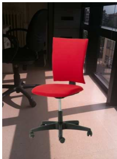
Figura 1. Simulación de la incorporación de muebles al entorno

En este sentido es importante hacer énfasis en el hecho de que este tipo de aplicaciones requiere por parte de la marca no solo presencia, sino una correcta gestión de la aplicación, pues su mal uso, desarrollo técnico, e incluso su carencia de actualizaciones puede ir en detrimento de la marca.