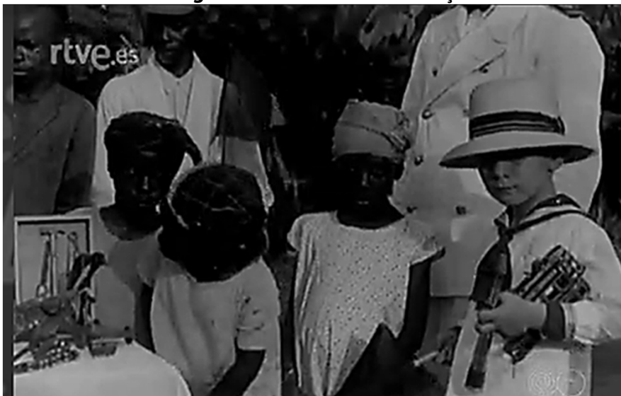
Figura 7. Estimulació a l'esforç