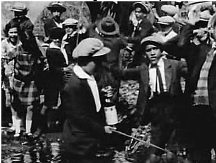
Figura 1. Documentació etnogràfica sobre comportaments infantils