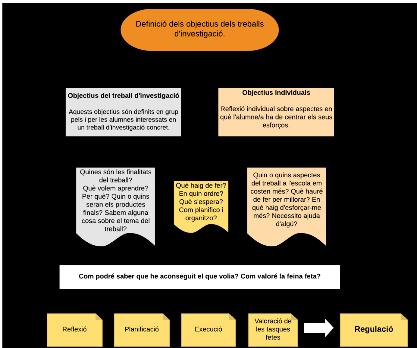
Taula 4. Definició dels objectius dels treballs d'investigació

La taula 4 il·lustra el procés de creació dels dos tipus d'objectius esmentats anteriorment i els resultats que pretenem obtenir amb la seva implantació.