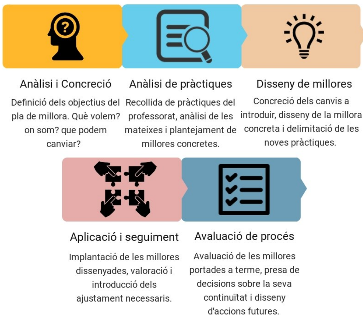
Taula 2. Fases del pla de millora.

Seguint els suggeriments de Lago i Onrubia (2011) es va dissenyar el pla de millora en 5 fases que ordenen, defineixen i regulen les actuacions més adients a portar a terme durant la implementació del pla. El següent gràfic detalla breument les fases d'implantació del procés que hem iniciat.