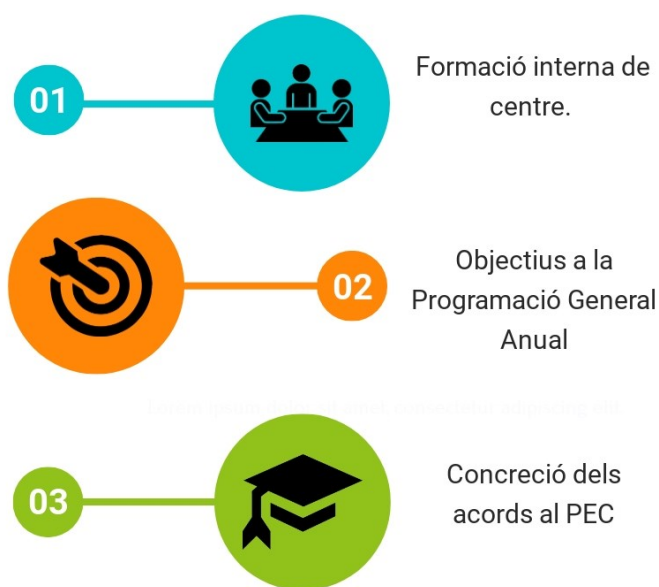
Taula 1. Abast del pla de millora.

curs i per tant quedi reflectit en els documents de gestió i funcionament del centre (vegeu taula 1).