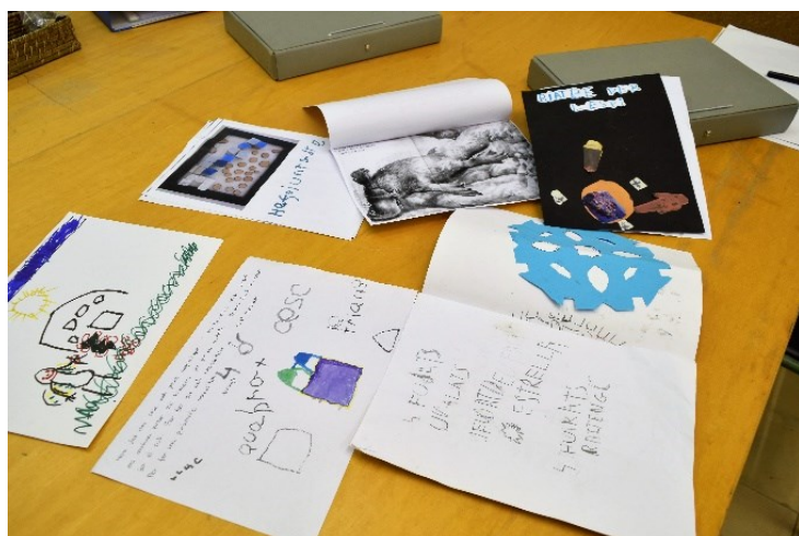
Taula 5. Les carpetes d'aprenentatge a Infantil.

Després d'un treball de recerca sobre eines i instruments per facilitar un procés d'avaluació conscient, formador i reflexiu s'han implementat les carpetes d'aprenentatge a infantil (la taula 5 és una mostra dels materials que contenen les carpetes). S'ha triat aquest instrument bàsicament perquè tal com apunten Beltran i Ojuel (2016) aquest recurs té com