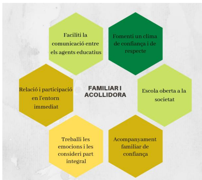
Esquema 2: Característiques escola acollidora.

es valora a tothom com a únic, singular i irrepètible. Vetllem per aconseguir un clima de confiança i de respecte , construint una relació emocional positiva. Treballem perquè l'infant sigui capaç de gestionar les seves emocions i traslladar aquest aprenentatge al seu entorn. Tenim present que les emocions són part integral de l'educació. Sabem que aquest resulta de la interacció dinàmica de l'emoció, la motivació i