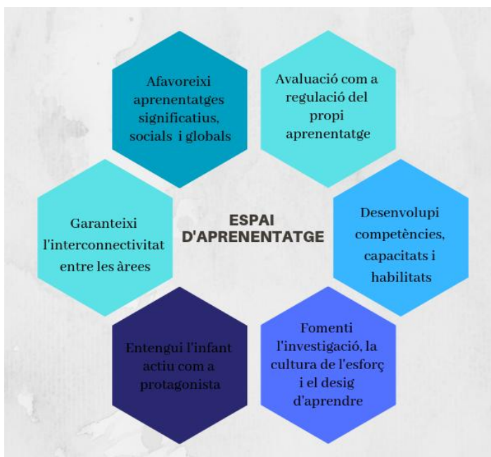
Esquema 1: Característiques espai d'aprenentatge.

propostes se centren en la seva cognició i el seu creixement. Les activitats oferides ajuden als infants a construir el seu aprenentatge a través del compromís i de l'exploració activa així doncs necessitem una escola que fomenti l' experimentació , el descobriment i la comprensió del món oferint un saber basat en la investigació que incita a la necessitat de preguntar-se, per satisfer el desig de comprendre. Els seus interessos i les propostes diàries són el mitjà