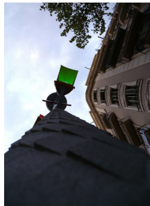
Figura 5. Semàfor en verd.

S'ha de posar la nota al peu de la figura en un cos de lletra més petit.