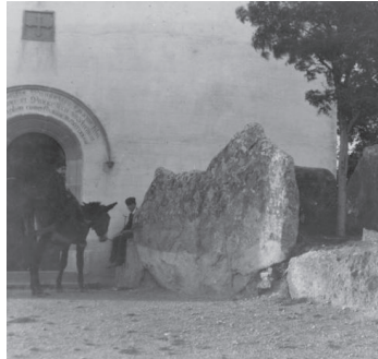
Figura 4. En esta fotografía puede apreciarse como a principios del siglo XX había un árbol en el espacio que queda entre las losas gigantes.

Cita bibliográfica en el texto del trabajo: “... en una fotografía anónima de principios de siglo se aprecia como el árbol había crecido entre las piedras del dolmen (véase figura 4).”