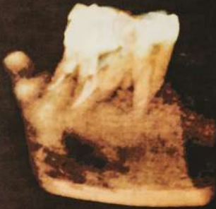
3D - Anterior