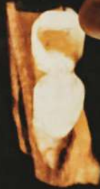
3D - Oclusal