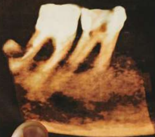
3D-Direito ou Vestibular