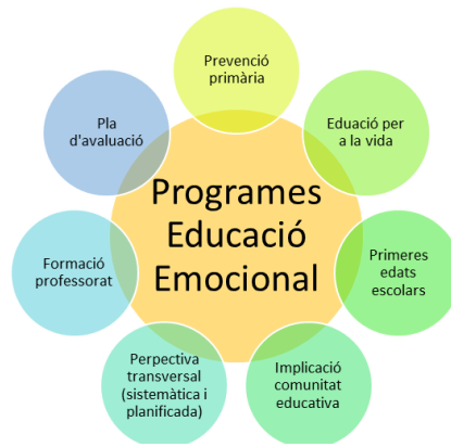
Figura 2: Característiques Programes Educació Emocional

Per la eficiència dels programes de educació emocional Bisquerra i García (2018) recomanen seguir les següents fases: